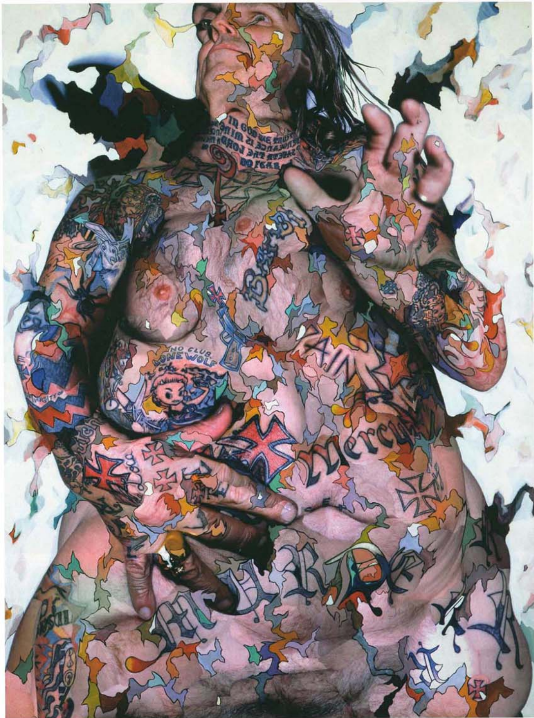
CHAMBLISS GIOBBI, Torso of Indian Larry , 2005. Collage, acrylic on aluminum panel, 172,7x233,7 cm.