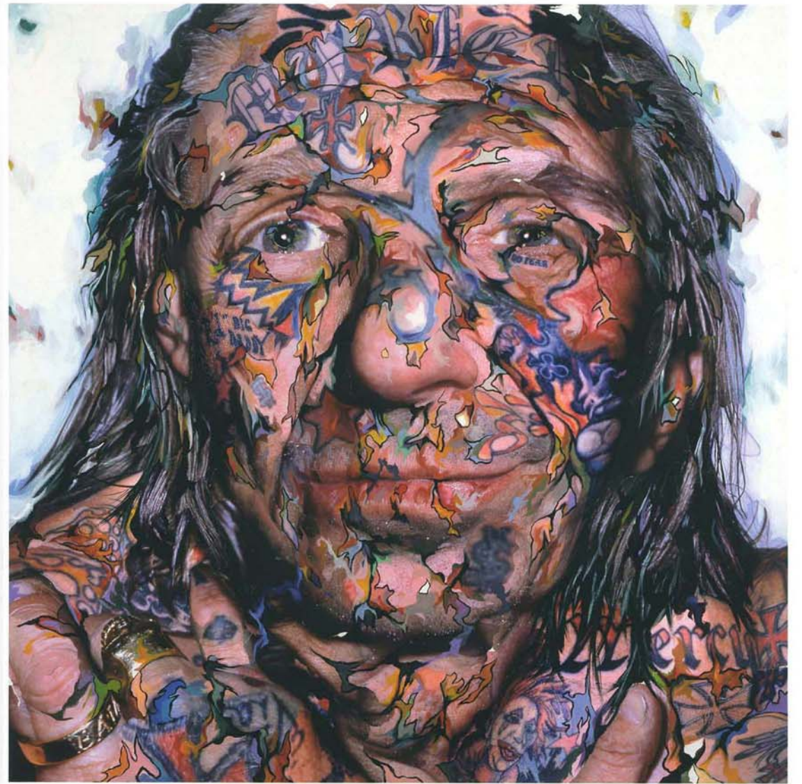
CHAMBLISS GIOBBI, Portrait of Indian Larry I , 2004. Collage, acrylic on aluminum panel, 152,4x152,4 cm.

CHAMBLISS GIOBBI Born 1963 in Mount Kisco, USA. Lives and works in New York, USA WEB www.chamblissgiobbi.com